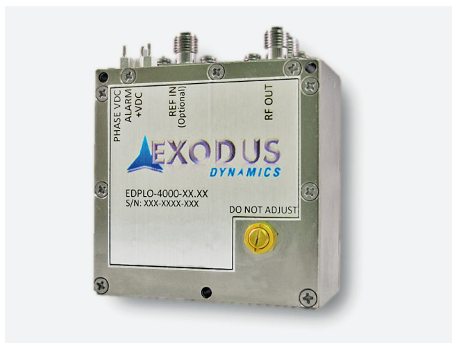
Рис. 41. Высокостабильный генератор с ФАПЧ серии EDPLO-4000 с внешним опорным генератором компании Exodus Dynamics