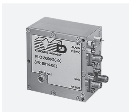
Рис. 40. Генератор с ФАПЧ PLO-3000-20.00 фирмы Microwave Dynamics